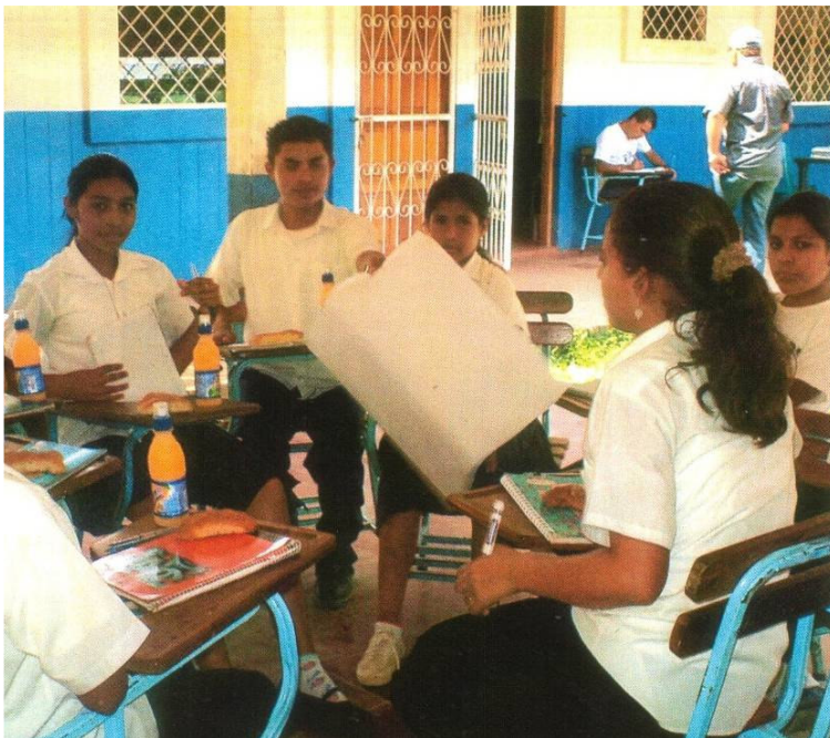
Atelier de genre dans l'école « Las Brisas » à Rancho Grande

En général, les participants sont motivés pour poursuivre le projet et conscients de son importance. On observe également une prise de conscience parmi les participants en ce qui concerne l'importance de continuer leur scolarité. Beaucoup d'entre eux pensent s'orienter vers des métiers sociaux pour améliorer les conditions de leur communauté.